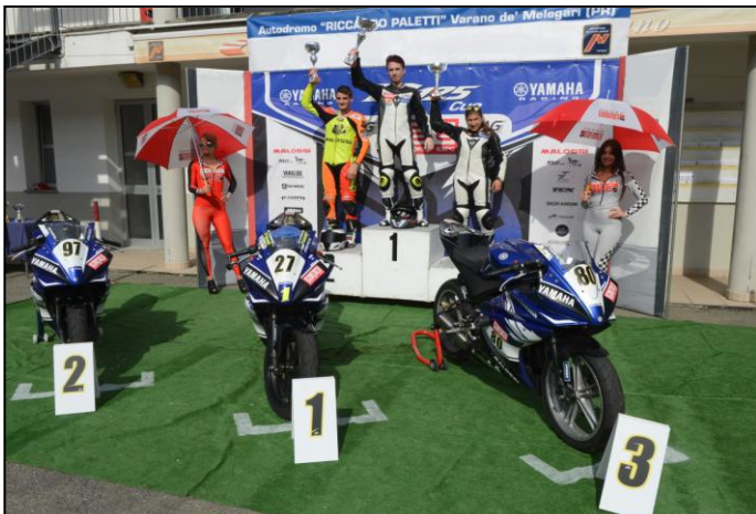
PODIO CLASSIFICA GENERALE TROFEO R125 CUP

Si conclude tra lacrime di emozione questa favolosa edizione del trofeo Yamaha R125 cup, un grande successo per il trofeo monomarca che ha contato 23 partecipanti, di cui 13 iscritti che affrontano per la prima volta il trofeo Yamaha, 11 i rookie, 3 i veterani che avevano già partecipato anche alle edizioni passate e 7 wild card, l'età prevalente è quella minorile con 14 piloti che sorpassa i 7 maggiorenni partecipanti. Se desiderate far parte di questa meravigliosa comunità, potete iscrivervi al gruppo facebook "trofeo Yamaha R125 cup" dove emozioni ed immagini sono a disposizione di chiunque voglia condividere il vero significato del motociclismo. AG Motorsport Italia, in qualità di scuola sportiva certificata dalla FMI ed organizzatori del trofeo, è a disposizione per qualsiasi consiglio ed informazioni, sarà inoltre un solido punto di appoggio per chiunque voglia partecipare al trofeo propedeutico che Yamaha ha creato per i giovani che desiderano entrare nel mondo delle gare divertendosi ed in sicurezza.