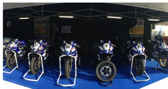
LE SUPERSPORTIVE YAMAHA R125 DA TROFEO