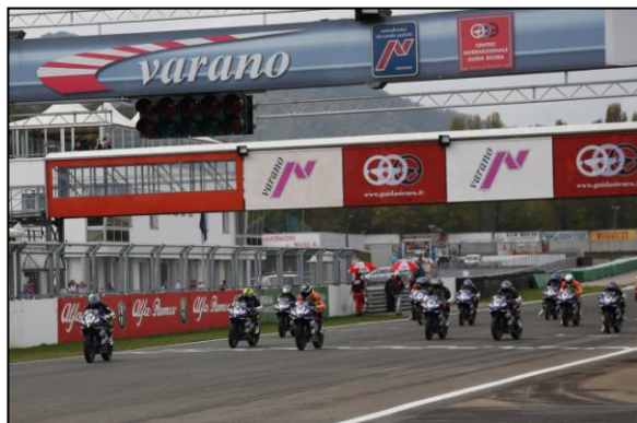
SI SPENGONO I SEMAFORI ED E' GARA!