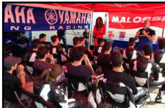
MOMENTI DI TEORIA DOPO LA PRATICA