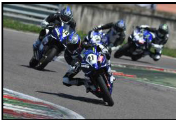
BAGARRE IN GARA