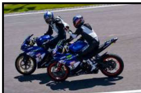
LA SPORTIVITA' TRA VINCITORI