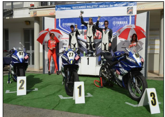
PODIO CLASSIFICA ROOKIE TROFEO R125 CUP

Appuntamento a gennaio 2014 per la premiazione dei vincitori del trofeo Yamaha R125 2014 presso la fiera di Verona - MOTOR BIKE EXPO, main sponsor del trofeo monomarca a tre Diapason. Ringraziamo inoltre Yamaha Motor Italia e Malossi, fondamentali per la realizzazione di questo trofeo insieme a Motor Bike Expo, ai nostri partner tecnici Mitas, Fabbri, Shark, Yamalube, Plastic-bike, Thermal Technology, Individual, TCX, Valter Moto, Midland, Starlane, Promoracing, Extreme Components, Takeshy Kurosawa, Gianluca Spinelli, un ringraziamento per aver contribuito al meraviglioso successo di questa edizione del trofeo Yamaha R125 cup.