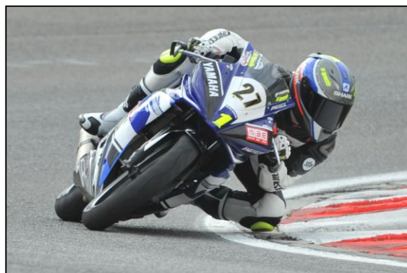
DI LONARDO VINCITORE DEL TITOLO R125 2014