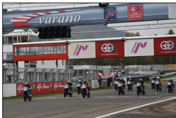
SI SPENGONO I SEMAFORI ED E' GARA!