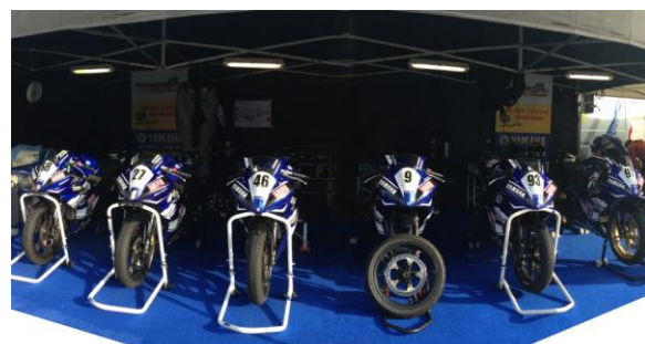
LE SUPERSPORTIVE YAMAHA R125 DA TROFEO